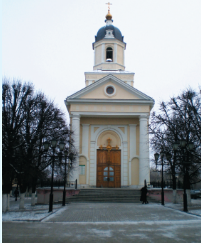
Храм Рождества Христова г. Чебоксары.